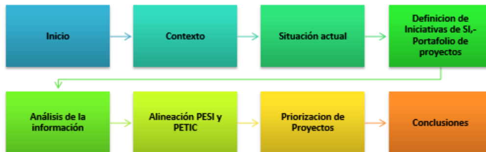
Ilustración 2. METODOLÓGICA UTILIZADA

La metodología utilizada para el desarrollo del PESI se muestra y se explica a continuación: