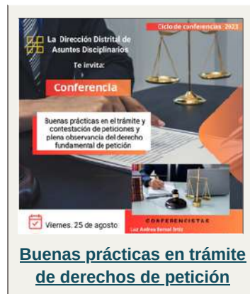
Buenas prácticas en trámite de derechos de petición