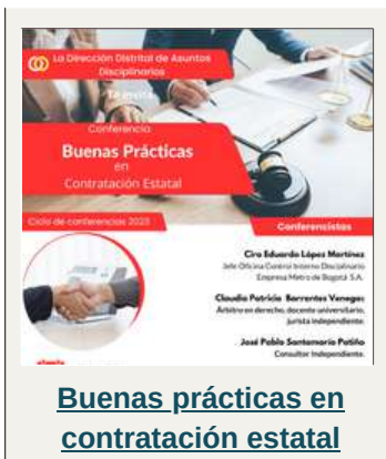
Buenas prácticas en contratación estatal