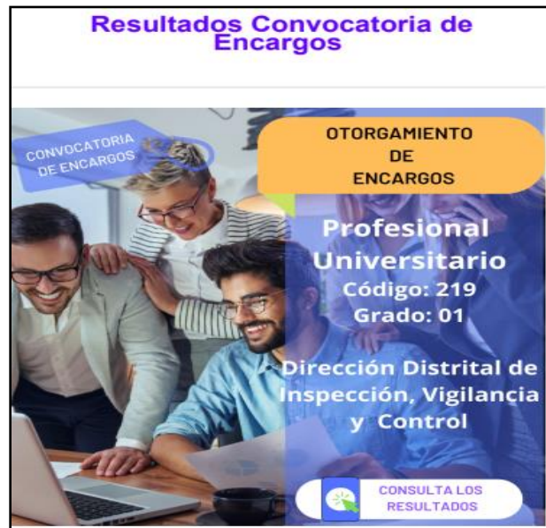
Imagen: Correos convocatorias de cargo, enviados por la Dirección de Gestión Corporativa.

Correo de fecha 20 de junio de 2023, asunto: Resultado definitivo Convocatoria Provisión Transitoria de Empleo mediante encargo del 05 de junio de 2023, como se puede observar en la siguiente imagen: