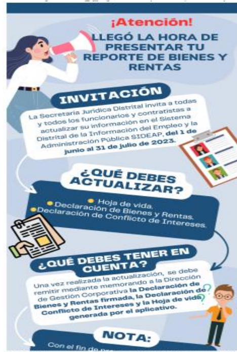
Imagen: Correos enviados por la Dirección de Gestión Corporativa.

La Dirección de Gestión Corporativa, solicitó durante los meses de junio y julio del año 2023, a través de correos de fecha 2, 7, 16, 23, 30 de junio y 7 de julio y Boletines Internos de fecha 9, 23 y 27 de junio de 2023, que los Servidores Públicos, realizaran la actualización de la hoja de vida, la declaración de bienes y Rentas y la declaración de conflicto de intereses, en el periodo comprendido entre el 1 de junio al 31 de julio de 2023.