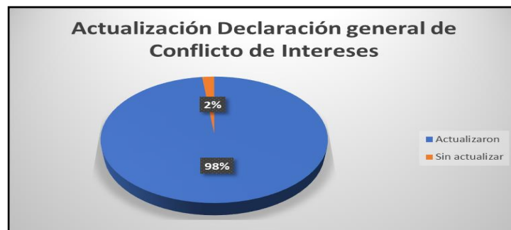
Fuente: Oficina de Control Interno. Información del aplicativo SIDEAP y Dirección de Gestión Corporativa.

De 162 funcionarios que se encuentran activos en la plataforma del SIDEAP, 158 realizaron el reporte en los tiempos establecidos en la mencionada circular externa, lo que corresponde al 98%. Cuatro (4) funcionarios (2 Profesionales Especializados 222 y un Profesional Universitario 219), no se evidencia la actualización en el aplicativo SIDEAP y un Técnico Operativo - 314, lo presentó extemporáneamente (3 de agosto de 2023).