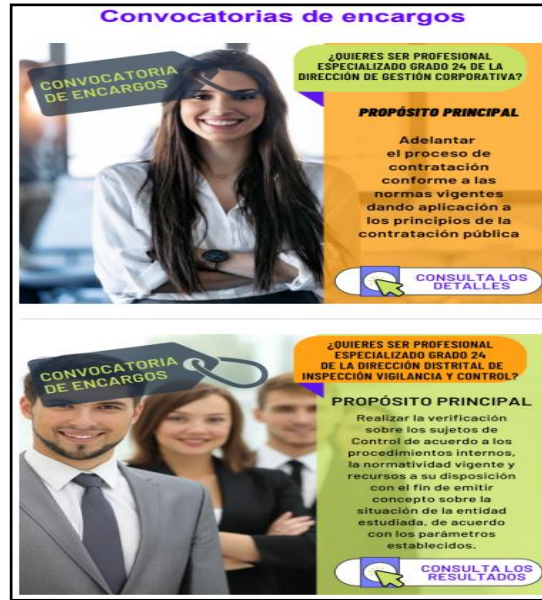
Imagen: Correos convocatorias de cargo, enviados por la Dirección de Gestión Corporativa.

Correo de fecha 20 de junio de 2023, asunto: Resultado definitivo Convocatoria Provisión Transitoria de Empleo mediante encargo del 05 de junio de 2023, como se puede observar en la siguiente imagen: