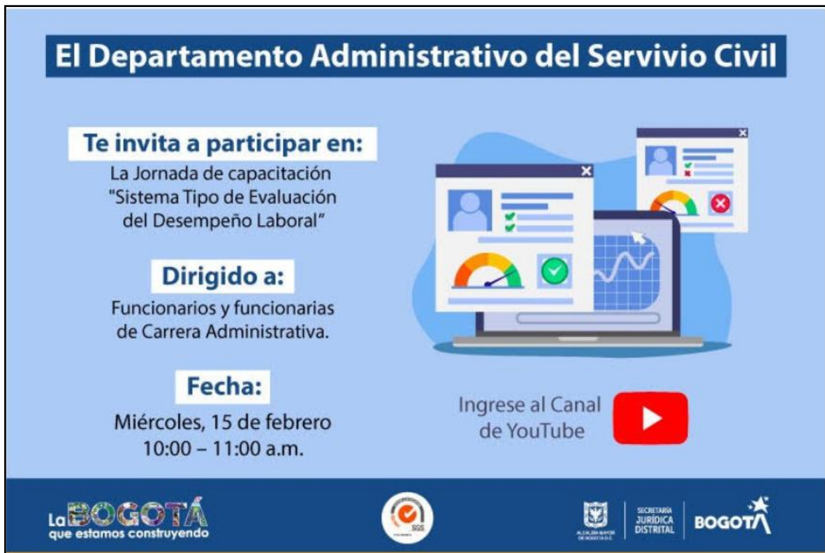
Imagen: Correo comunicaciones Secretaría Jurídica Distrital.

Mediante correo del 14 de febrero de 2023, invitó a todos los funcionarios a que asistieran a la capacitación virtual del Departamento Administrativo del Servicio Civil, en donde se haría una jornada de capacitación “Sistema Tipo de Evaluación del Desempeño Laboral.